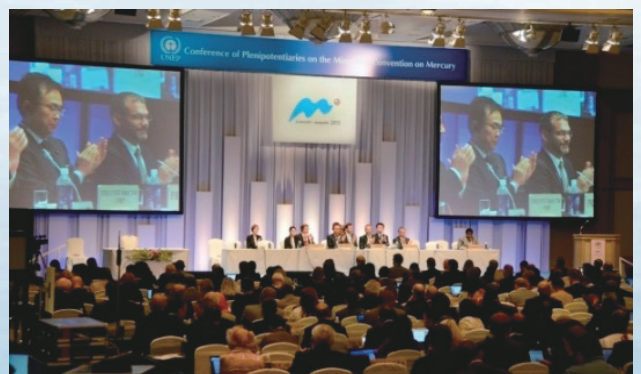
熊本県水俣市で開催された、水俣条約外交会議の様子

And in October 9, 2013, diplomatic conference of [Minamata Convention on Mercury] was held in Minamata-shi, Kumamoto, Japan, where 92 of the countries / regions had agreed and signed to.