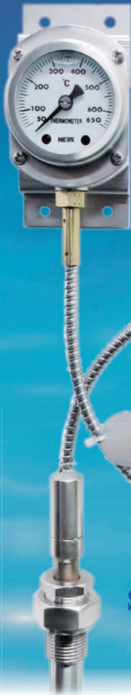
SEGTEMP-50R [ Model : 2TUGA ]