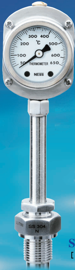
SEGTEMP50 [ Model : 2SUGA ]