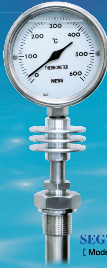
SEGTEMP75 [ Model : 3SUGS ]