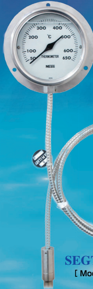
SEGTEMP-75R [ Model : 3TUGS ]